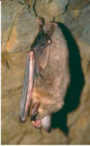
D. MORIN - CPEPESC