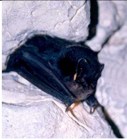
Yvan BINOT - CPEPESC